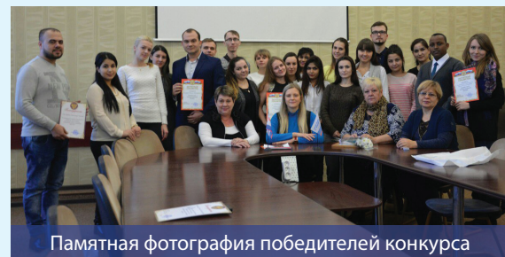
Памятная фотография победителей конкурса