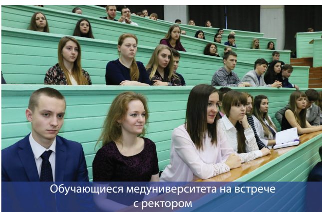
Обучающиеся медуниверситета на встрече с ректором