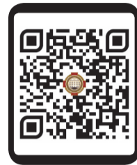
электронный архив газет ВГМУ