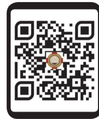
сайт ВГМУ им. Н.Н. Бурденко