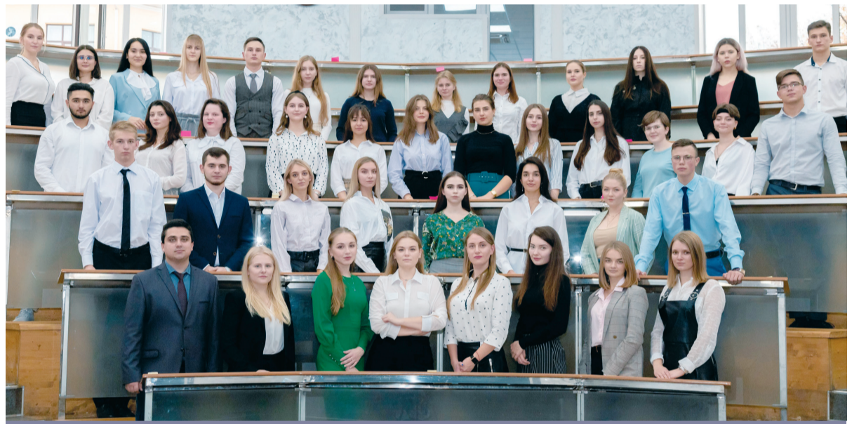
Состав Совета СНО. 2020-2021 годы