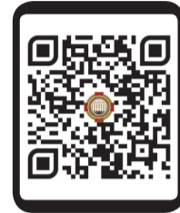
электронный архив газет ВГМУ