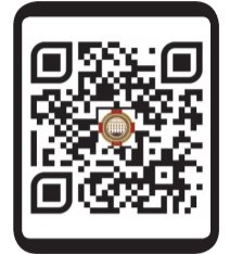
сайт ВГМУ им. Н.Н. Бурденко