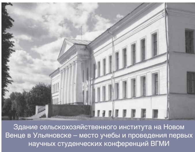
Здание сельскохозяйственного института на Новом Венце в Ульяновске – место учебы и проведения первых научных студенческих конференций ВГМУ