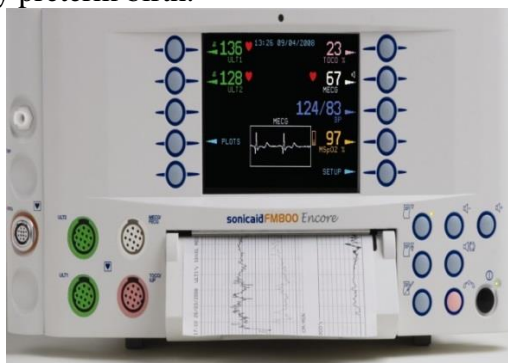
Figure 1: Sonicaid Team («Oxford Instruments Medical», Great Britain)

At present, to determine the status of antenatal fetus often use fetal monitors Sonicaid Team («Oxford Instruments Medical», UK) with the program "System 8000". Criteria for evaluation of CTG automated data in real time have been designed G.Dawes, C.Redman and M.Moulden and are based on multivariate statistical retrospective clinical evaluation of tens of thousands of CTG. The data is compared with the patient's specific regulatory credible indicators, taking into account the duration of pregnancy. Using of this program is already possible from 24 weeks of pregnancy, that is, with the terms of the very early preterm birth.