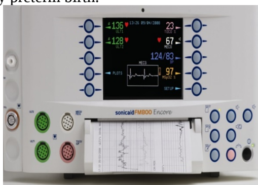
Figure 1: Sonicaid Team («Oxford Instruments Medical», Great Britain)

At present, to determine the status of antenatal fetus often use fetal monitors Sonicaid Team ( «Oxford Instruments Medical», UK) with the program "System 8000". Criteria for evaluation of CTG automated data in real time have been designed G.Dawes, C.Redman and M.Moulden and are based on multivariate statistical retrospective clinical evaluation of tens of thousands of CTG. The data is compared with the patient's specific regulatory credible indicators, taking into account the duration of pregnancy. Using of this program is already possible from 24 weeks of pregnancy, that is, with the terms of the very early preterm birth.