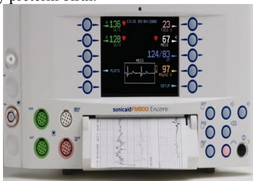
Figure 1: Sonicaid Team («Oxford Instruments Medical», Great Britain)

At present, to determine the status of antenatal fetus often use fetal monitors Sonicaid Team («Oxford Instruments Medical», UK) with the program "System 8000". Criteria for evaluation of CTG automated data in real time have been designed G.Dawes, C.Redman and M.Moulden and are based on multivariate statistical retrospective clinical evaluation of tens of thousands of CTG. The data is compared with the patient's specific regulatory credible indicators, taking into account the duration of pregnancy. Using of this program is already possible from 24 weeks of pregnancy, that is, with the terms of the very early preterm birth.