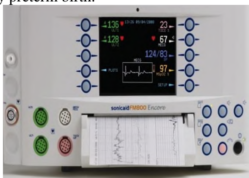
Figure 1: Sonicaid Team («Oxford Instruments Medical», Great Britain)

At present, to determine the status of antenatal fetus often use fetal monitors Sonicaid Team («Oxford Instruments Medical», UK) with the program "System 8000". Criteria for evaluation of CTG automated data in real time have been designed G.Dawes, C.Redman and M.Moulden and are based on multivariate statistical retrospective clinical evaluation of tens of thousands of CTG. The data is compared with the patient's specific regulatory credible indicators, taking into account the duration of pregnancy. Using of this program is already possible from 24 weeks of pregnancy, that is, with the terms of the very early preterm birth.