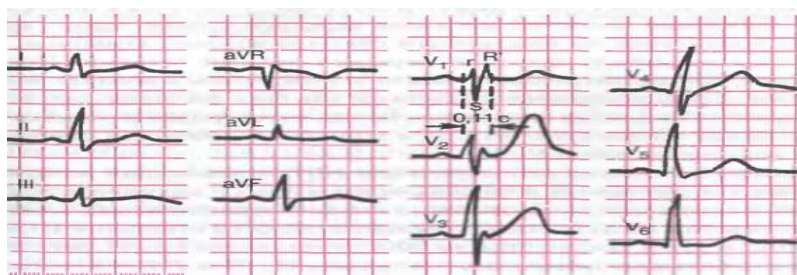
ЭКГ больного В., 58 лет

В анализах крови: гемоглобин – 134 г/л; Эритроциты – 4,3 млн.; гематокрит – 43%; лейкоциты – 5,1 тыс.; п/я – 1%; с/я – 64%; лимфоциты – 28%; эозинофилы – 2%; моноциты – 5%; СОЭ – 12 мм/ч. В биохимическом анализе крови: глюкоза – 5,2 ммоль/л; креатинин – 0,01 ммоль/л; общий билирубин – 18 ммоль/л, общий холестерин 5,8 ммоль/л, ХС ЛПНП – 3,4 ммоль/л, триглицериды – 2,4 ммоль/л.